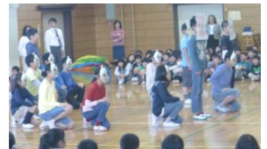
1年生を迎える会の様子

本校に着任してから一月がたちました。1年生45名を含め、11クラス、計280名の児童、そして意欲に満ちた先生方とともに毎日を過ごしていると、あっという間に時間がたってしまいました。